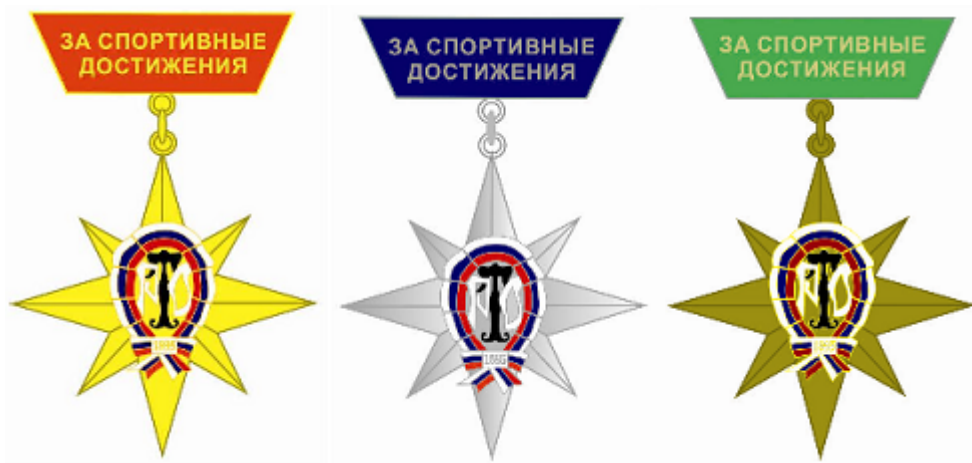
РИСУНОК НАГРУДНОГО ЗНАКА «За спортивные достижения в туризме»

При помощи ушка в верхней части и кольца знак соединен с четырехугольной колодкой трапециевидной формы высотой 10 мм. с основаниями 27 и 19 мм., залитой цветной эмалью и имеющей надпись «ЗА СПОРТИВНЫЕ ДОСТИЖЕНИЯ».