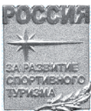
Знак II степени