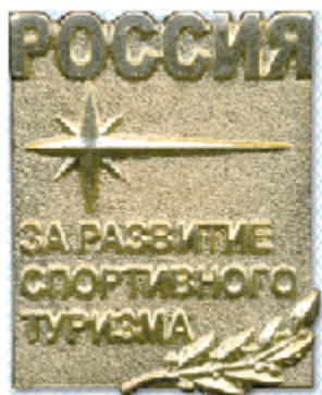
Знак I степени