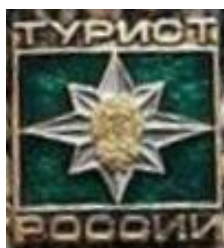
РИСУНОК НАГРУДНОГО ЗНАКА «ТУРИСТ РОССИИ»

Лицам, выполнившим установленные требования и нормы, вручаются удостоверение и знак установленного образца. Знак «ТУРИСТ РОССИИ» носится на левой стороне груди ниже государственных наград.