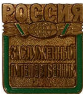
РИСУНОК НАГРУДНОГО ЗНАКА «Заслуженный путешественник России»

Знак выполнен из медно-никелевого сплава с чернением плоскостей, на которых расположены надписи. По всему периметру квадрата, кроме верхней части, идет цветная темно-зеленая полоса.