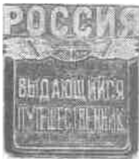
РИСУНОК НАГРУДНОГО ЗНАКА «Выдающийся путешественник России»

Приложение №1 к Положению о Почетном знаке «Выдающийся путешественник России»