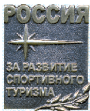
Знак III степени