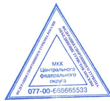
Рис. 3. ОМКК ЦФО

4. Все МКК, относящиеся к региональной ФСТ, обозначаются так же трехзначным числом: первая из которых «1» (единица), вторая и третья цифра в штампе обозначают код субъекта РФ в соответствии с Приложением №2.