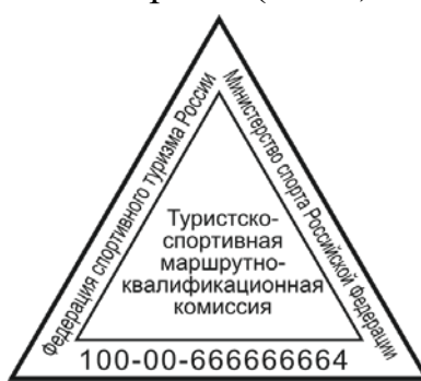
Рис. 2. ЦМКК