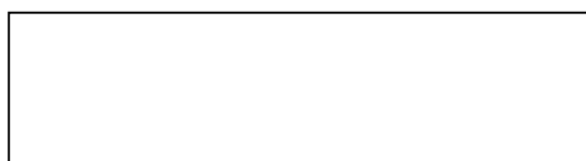
Рисунок 1 – Текст

Текст. Текст. Текст. Текст. Текст. Текст. Текст. Текст. Текст. Текст. Текст. Текст. Текст. Текст. Текст. Текст. Текст. Текст. Текст. Текст. Текст. Текст. Текст. Текст. Текст. Текст. Текст. Текст. Текст.