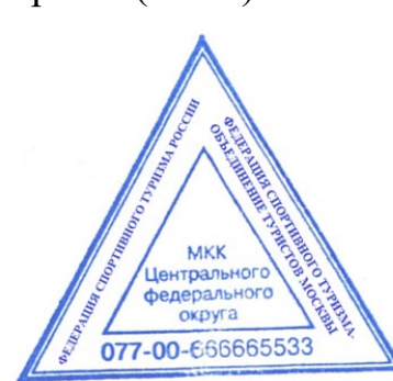
Рис. 3. ОМКК ЦФО

4. Все РМКК, относящиеся к региональным ФСТ, обозначаются так же трехзначным числом: первая из которых «1» (единица), вторая и третья цифра в штампе обозначают код субъекта РФ в соответствии с Приложением №2 Положения о МКК.