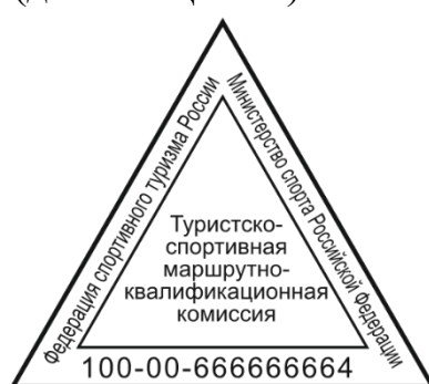
Рис. 2. ЦМКК