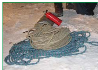
В наше время мы изобавлены любой веревкой, любого диаметра и любой фирмы

В тот период было переходное время в различных видах этого изделия. Крученой веревкой мы уже почти не пользовались. Государство позаботилось не о нас, а о рыбодобывающей промышленности. Заводы в то время тоннами выпускали изделие под названием «фал». Он нас устраивал. Мы его натягивали на всех туристских слетах, наводя переправы. Ломали при этом наши стальные карабины. Было и такое. Тогда и родился термин «перетянули веревку».