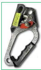
Жумар «Альтурс» российского производства