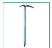
Классический ледоруб 2000 годов фирмы Simond Ocelot Hyperlight 60 см, Франция