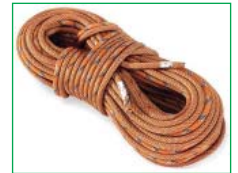
Так выглядела первая альпинистская веревка (динамика) из города Калининграда, 80-90-е годы