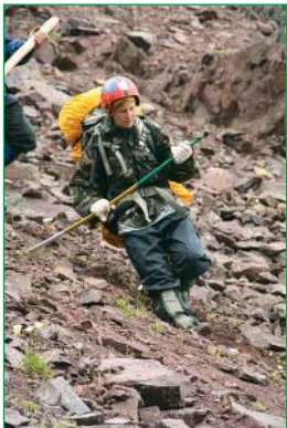
Работа горного туриста с альпенштоком на крутом склоне

В конце 90-х годов я начал работать в магазине Попутчик. У меня появился фирменный французский ледоруб Simond Ocelot Hyperlight Франция. Очень легкий, практичный. Я его берег до тех пор, пока его на сборы не взял один дружок в район Тянь-Шаня. Что там с ним делал, я не знаю. Наверное, камни выковыривали при постановке палаток. Вид у него был удручающий.