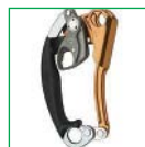
Чудо техники 2000-х годов жумар на шарнирах nForce фирмы Black Diamond