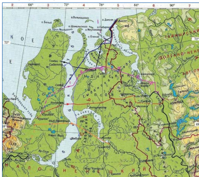
Маршруты, пройденные на Гыдане с 1977 г. по 2009 г.

Наша дорога на Таймыр началась 13 марта в поезде Москва – Лабитнанги. По расписанию прибыли в Обскую, где удалось подсесть на поезд, идущий уже на Ямал. На полуострове активно развивается транспортная сеть. Газпромом железнодорожная ветка проложена уже до реки Юрибей, а планируется вскоре дотянуть ее до Харасавея. На всех разъездах имеются современные хорошо оборудованные станционные помещения. Завозятся материалы и рабочая сила для строительства крупных поселков. В ближайшей перспективе – строительство ветки до Нового Порта.