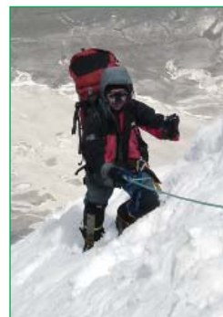
Работа с жумаром на перилах

Молодые! Новички! Есть мудрая пословица: «Дареному коню в зубы не смотрят». Но есть еще и твоя жизнь. Старайтесь быть всегда умнее. Проверяйте всё снаряжение дома, до выезда в горы.