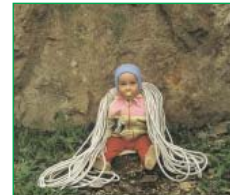
Так выглядит труженик нашего времени – советский альпинистский фал с 70-х годов по настоящее время