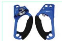
Фирма Венто пошла верным путем и выпустила жумар, ну чем не Petzl